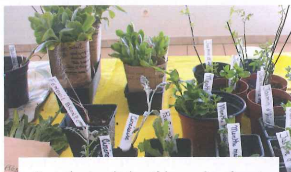
Les plantes étaient bien préparées et étiquetées