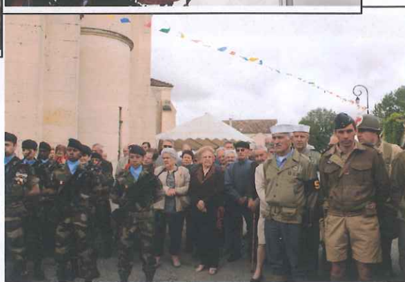
Nos anciens à l'honneur