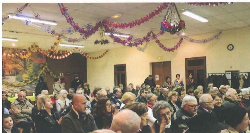
Toujours autant de monde pour les voeux en 2016. RDV le 21 janvier à 18h00